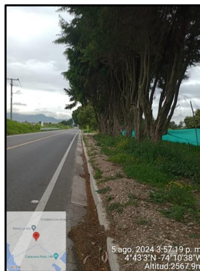
Ilustración 5. Evidencia recorrido, punto 4.