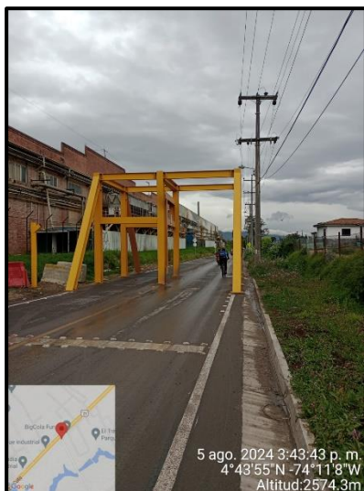
Ilustración 2. Evidencia recorrido, punto 1.

Durante el recorrido de control y vigilancia en la vereda El Hato no se evidenciaron anomalías que afecten el componente ambiental, como se observa en las siguientes ilustraciones.