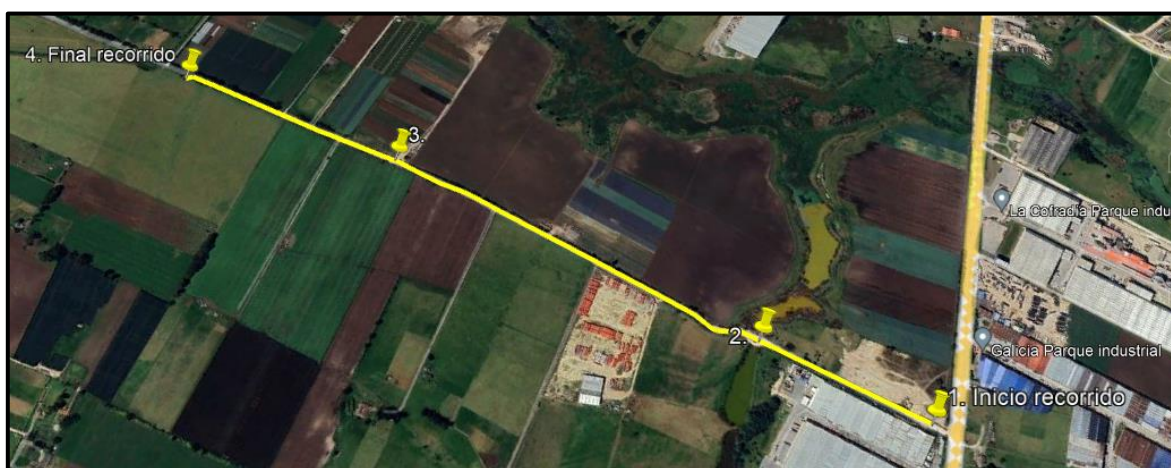
Ilustración 1. Recorrido verificación ambiental - Vereda El Hato.

Se realizó recorrido de control y vigilancia en la vereda El Hato el día 05 de agosto de 2024, desde las coordenadas 4°43'55"N - 74°11'8"W hasta las coordenadas 4°43'3"N - 74°10'38"W (ver ilustración 1. Ruta amarilla), con el fin de verificar las condiciones ambientales, identificar posibles afectaciones a los recursos naturales y realizar las acciones de prevención correspondientes.