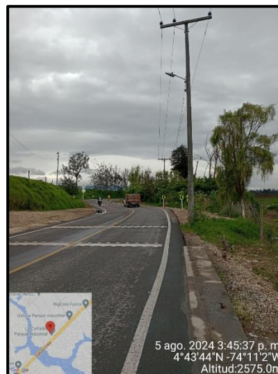
Ilustración 3. Evidencia recorrido, punto 2.